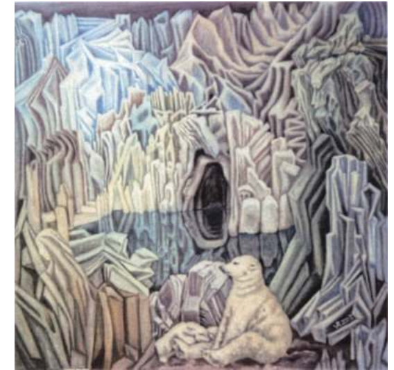
„Ewiges Eis, wie lange noch?“