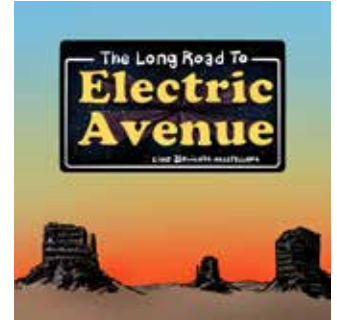
Der Belichta, The Long Road to Electric Avenue

The Long Road to Electric Avenue fortlaufend 18.00 Uhr bis 23.00 Uhr