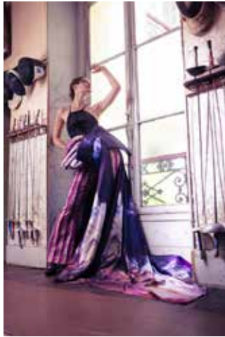
Mode: Sara Stubenbaum

Eine multimediale Expedition in die Fechtkunsthistorik, die sich mit Reflexionen über die Frage der Kunst im Kampfe sowie dem inneren Kampf der Künstlerin beschäftigt. Im Rahmen ihrer Masterarbeit im Fachbereich Modedesign der Hochschule Trier entstand eine Kollektion inspiriert durch die heimische Sammlung historischer Hieb- und Stichwaffen ihres Vaters, als auch der legendären Fechterin und Opernsängerin Julie de Maupin (17. Jh.) mit dem Ziel, die Welten der Kampfkunst, der Bildenden Kunst und der Angewandten Kunst zu vereinen. Die Silhouetten, verschmolzen mit allegorischen, skulpturalen Elementen, eigenen malerischen und grafischen Werken, wachsen in dieser Ausstellung zu einer immersiven Installation über die Mode hinaus und laden die Besucher ein, hinter die Kulissen des Schaffensprozesses zu blicken.