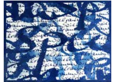
Renate Heineck, Spielraum

fortlaufend von 18.30 Uhr bis 23.00 Uhr gabbro kokott bietet die Aktion „make your own gabbro“ an, bei der Besucher:innen der Jahresausstellung der Kulturwerkstatt in der „Langen Nacht der Kunst Trier“ ihre eigene Collage mit von gabbro kokott vorbereiteten Fotoplatten realisieren können.